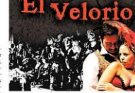
LA INVITACIÓN ES GUARDAR en una chusa campesina, protagonizada por una viuda, un bandolero, hombre de campo y mujer de la vida.

4 de septiembre se presentará la única función en el Aula Magna de la Universidad de la Frontera.