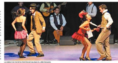
LA OBRA FUE ESCRITA POR ÓSCAR SALINAS EL AÑO PASADO.

4 de septiembre se presentará la única función en el Aula Magna de la Universidad de la Frontera.